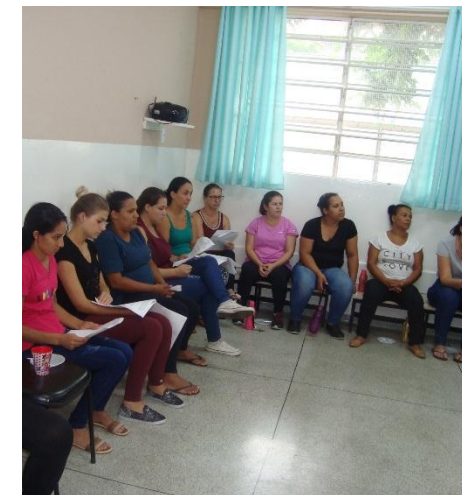
Sede: Rua Guarin João Badin, 50 – Jardim Morada do Sol – (19)3816-1637