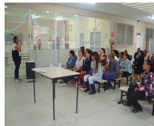
Sede: Rua Guarin João Badin, 50 – Jardim Morada do Sol – (19)3816-1637