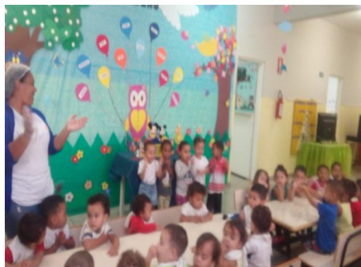
Aniversariantes do mês