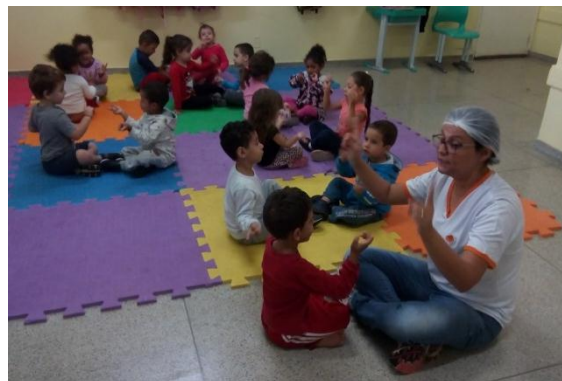
Brincadeira de imitação