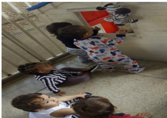
Brincadeira dirigida no parque