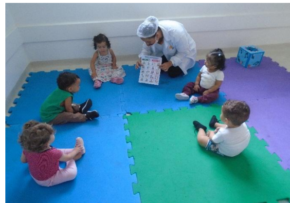
Regrinhas de convivência