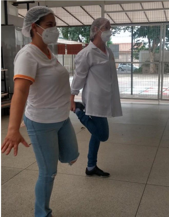
Projeto Viva Bem/ Ginástica laboral