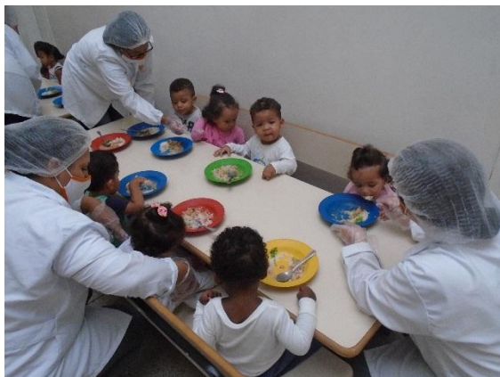
Hora do almoço