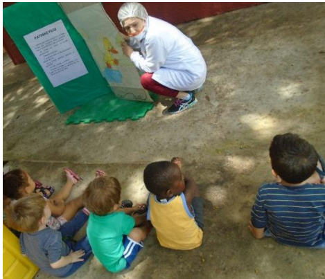
História com livro gigante