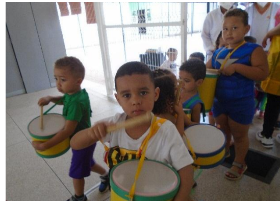
Trabalhando os ritmos com a bandinha.