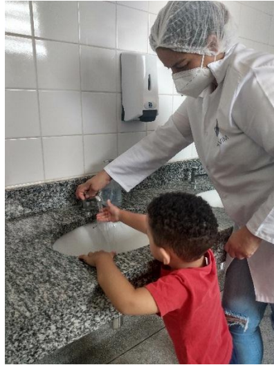
Autocuidado/higienização das mãos