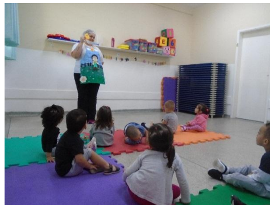
História com avental