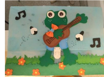
PROJETO BRINCANDO COM O CORPO

*OS PROJETOS INTERATIVOS FORAM SUSPENSOS EM VIRTUDE DA PANDEMIA DE COVID-19.