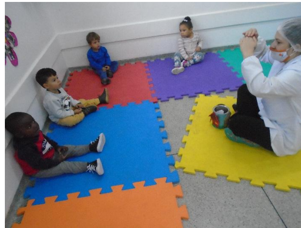
Poema: A casa e seu dono