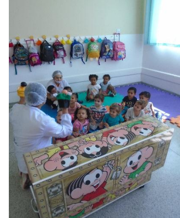
História sobre a Amizade