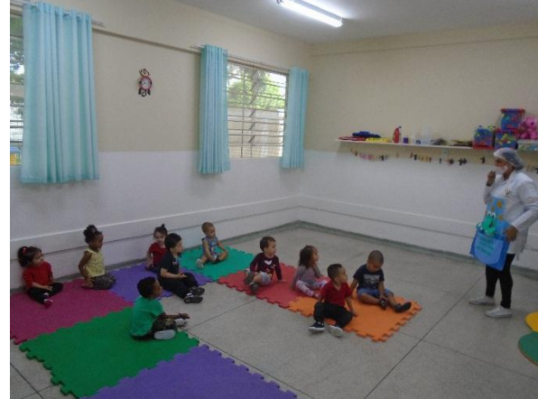
História trabalhando o autocuidado/Escovação