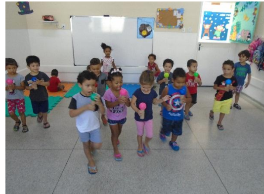
Treinando o equilíbrio