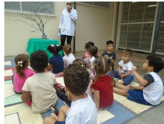
História: A árvore sem folhas