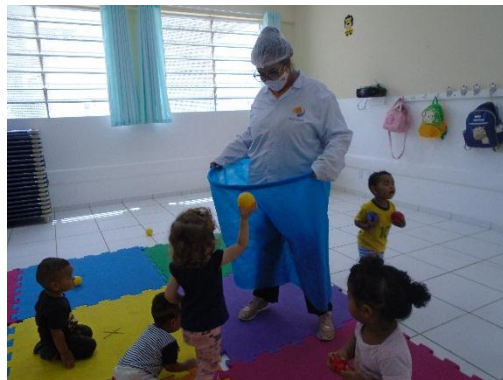
Brincadeira dirigida “Acerte se puder”