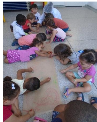
Pintura livre no papel Kraft