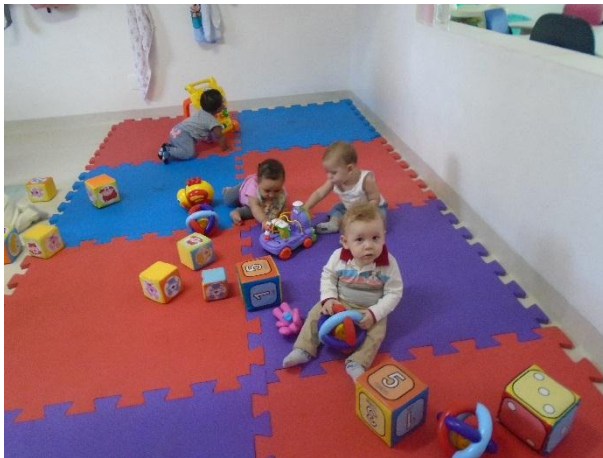
Escolha do brinquedo