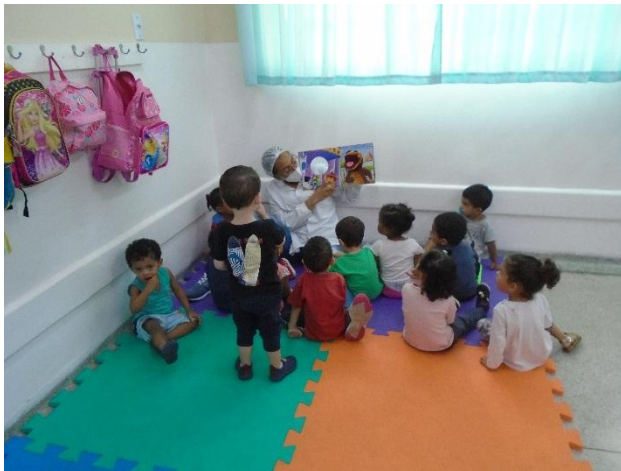
Contação de história com o livro de fantoche